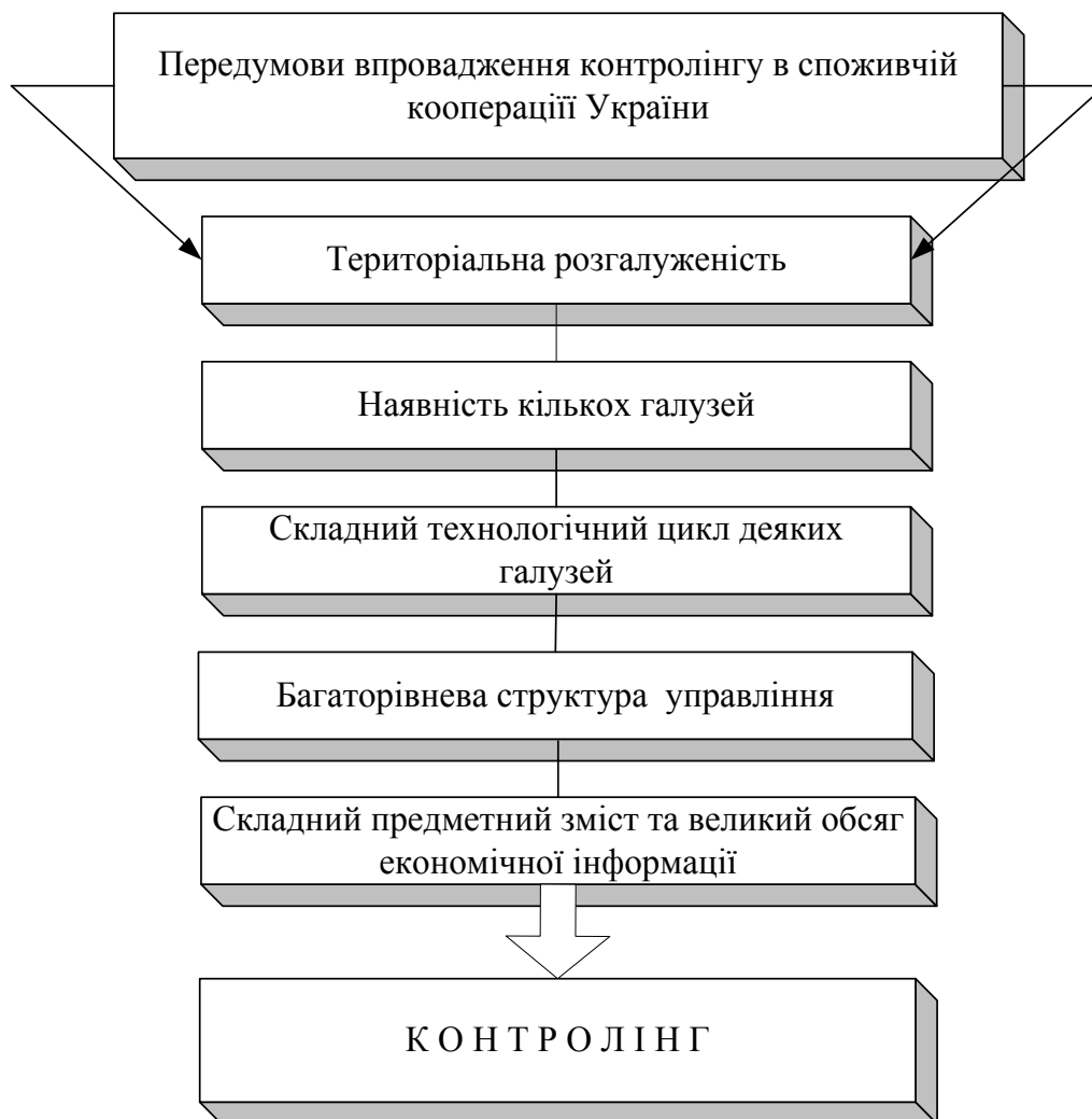
Рис. 3. Передумови впровадження контролінгу в споживчій кооперації України (сформовано автором)

Висновки і перспективи подальших досліджень у даному напрямі. Доповнюючи названі передумови, можна зазначити, що поява контролінгу викликана потребами сьогодення. Підвищення нестабільності зовнішнього середовища висуває додаткові вимоги до обліково-аналітичної компоненти системи управління підприємством, а саме: зміщення акценту з контролю минулого на аналіз майбутнього; збільшення швидкості реакції на зміни зовнішнього середовища, підвищення гнучкості підприємства; необхідність у безперервному відстежуванні змін, що відбуваються в зовнішньому і внутрішньому середовищах підприємства; необхідність продуманої системи дій щодо забезпечення виживання підприємства й уникнення кризових ситуацій. До того ж, сучасному розвитку суспільства притаманне загальне прагнення до інтеграції різних галузей людської діяльності загалом, зокрема інформаційних процесів.